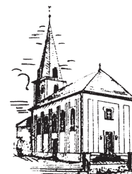
Filialgemeinde St. Cyriakus Staffelbach (STB)

Bürozeiten im Pfarrbüro: Dienstag von 9.00 bis 10.30 Uhr und Mittwoch von 16.30 bis 18.30 Uhr · Tel. 09503 206