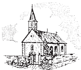
Kuratie St. Barbara Unterhaid (UH)